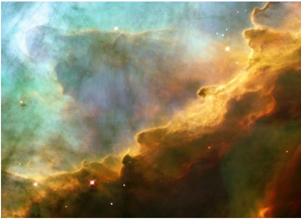
Nébuleuse M17 : photographie prise par le télescope Hubble